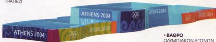
• ΒΑΘΡΟ ΟΛΥΜΠΙΑΚΩΝ ΑΓΩΝΩΝ

Συνεργάστηκε με τον Karim Rashid για πελάτες όπως η PRADA, το όνομά του έχει φιγουράρει στα πιο γνωστά ξένα περιοδικά όπως τα «I-D» και «WALLPAPER», σχεδίασε τα βάρθρα των Ολυμπιακών και Παραολυμπιακών Αγώνων του 2004. Κινείται μεταξύ Γενεύης και Αθήνας όπου δραστηριοποιείται μέσω του γραφείου του chd.