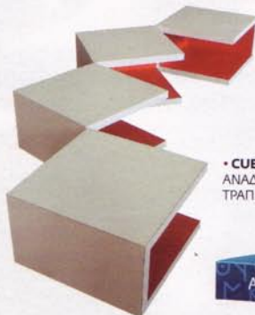
• CUBE ΑΝΑΔΙΠΛΟΥΜΕΝΟ ΤΡΑΠΕΖΙ